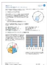
ファシリテーター用 補足レポート